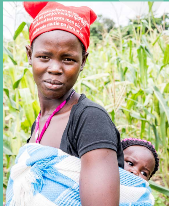
Im Projekt unserer Partnerorganisation MEMPROW in Uganda unterstützen wir junge Mütter.