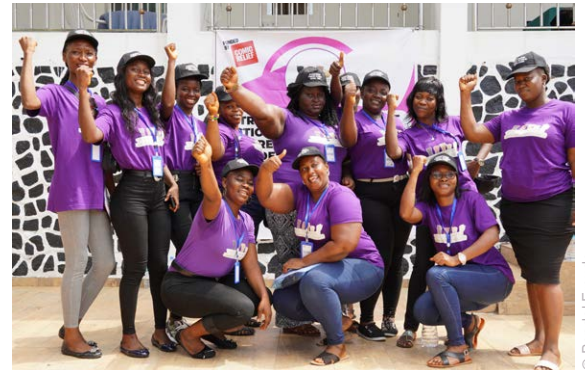
Die Freiwilligen von Girl2Girl in Sierra Leone klären Mädchen zu Themen wie Sexualität und Frauenrechten auf.